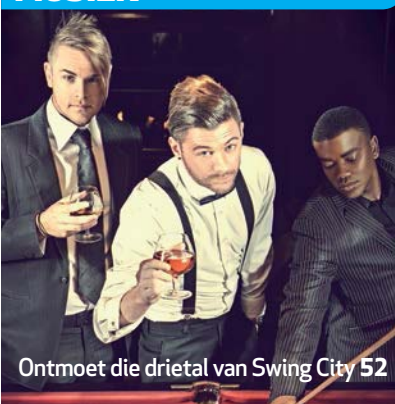
Ontmoet die drietal van Swing City 52