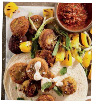
Aandete in 'n halfuur 30 Viskoeokies is dié week se wenresep 33