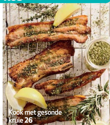
Kook met gesonde kruie 26