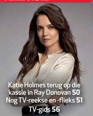
Katie Holmes terug op die kassie in Ray Donovan 50 Nog TV-reekse en -fleks 51 TV-gids 56