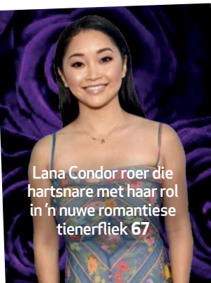
Lana Condor roer die hartsnare met haar rol in 'n nuwe romantiese tienerfiek 67

Desmond John gesels oor soet en suur 68 Lawwe modes 70 Motors kom al 'n lang pad 72 Kinderspeletjies 74 Hibriedmotors bied middeweg 76